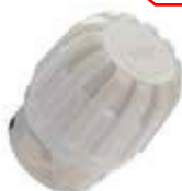
Handratt vit Art nr 480 60 97